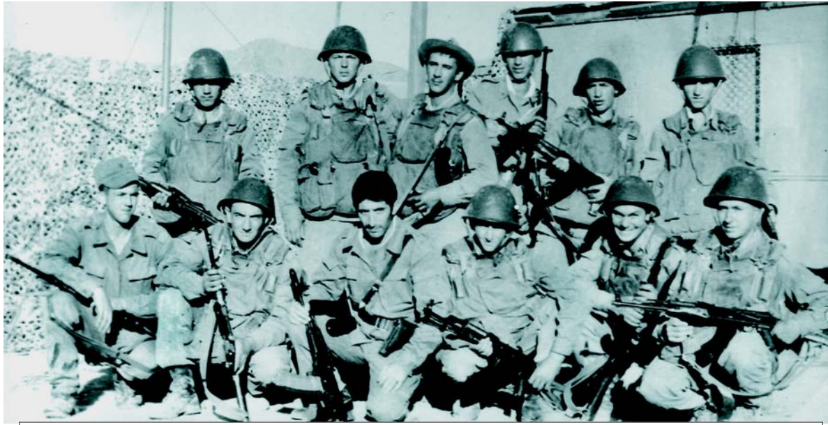
Воины-интернационалисты 80-х годов в Афганистане